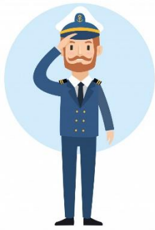
Decisión del Capitán

Avería Gruesa o General: Es el daño provocado intencionalmente por el capitán cuando, por salvar a la nave y a la tripulación, decide hacer echazón , entendido como el acto de arrojar intencionalmente por la borda, parte de la carga.